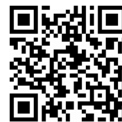
แสกน QR code ลงทะเบียนยืนยันเข้าร่วมนำเสนอ